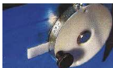
Volumen cubeta ajustable