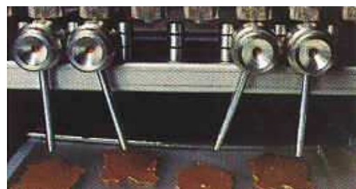
Fácil de ajustar para todo tipo de moldes.