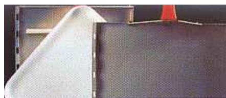
Fácil de sacar el producto.